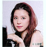
細川千尋 (ジャズ・ピアノ)