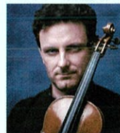
アルド・カンパニャーリ (ヴァイオリン)