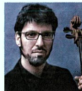
フランチェスコ・ディロン (チェロ)