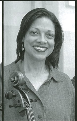
チェロ アストリッド・シュウイーン

比類なき芸術性と不朽の活力で、ジュリアード弦楽四重奏団は世界中の観衆を魅了し続けている。1946年に創設、米紙ポスト・グローブで「我が国の弦楽四重奏団史上、最も重要な存在」と評された同団は、古典作品にたゆまぬ探究心を傾けると同時に、新しい作品にも果敢に取り組み、伝統を守りつつ大胆な挑戦をするという姿勢を貫いてきた。彼らが届けるのは常に、唯一無二の音楽。それは4人に共通する、作品に対する深い洞察と全身全霊の傾注、そして弦楽四重奏という芸術に潜む驚嘆を分かち合いたいという飽くなき好奇心の結実である。