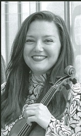
ヴァイオリン アレタ・ズラ